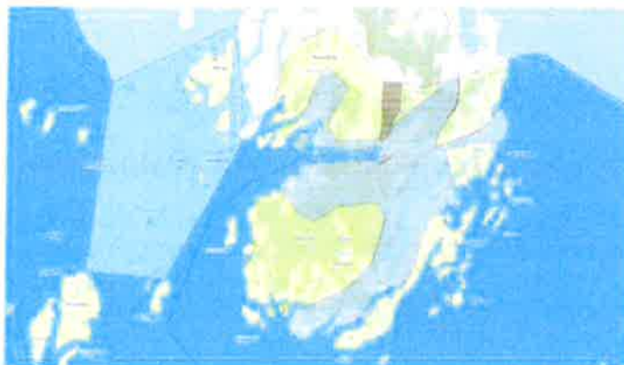
Figur 2. Utdrag fra areadelen ved Nesøya

Kommunen har også vært i prosess Kystplan Helgeland i de siste 5 år. I 2. gangs høringsforslag Kystplan Helgeland er området avsatt til Bruk og vern av sjø og vassdrag, med tilhørende strandsone med inkludert underformål akvakultur.