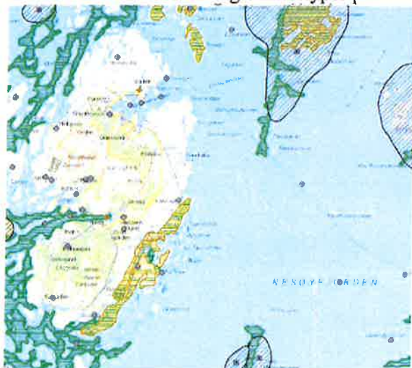
Figur 3. Utdrag fra naturdatabase

Naturbase viser noen utvalgte naturtyper på land.