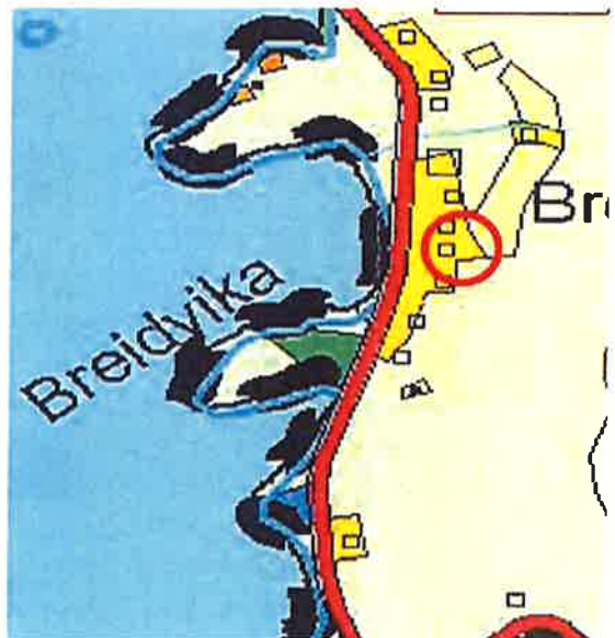
Figur 3; innspill kommunedelplan

Bakgrunnen for ønsket tomt er at det vil være enklere adkomst til tomten, samt at det er der kjøper ønsker å bygge. En tomt slik som ønsket i figur 1 vil komme høyt i terrenget. Sammenlignet med hytte bygd lenger nord 47/197, og sør 47/106 (se oversiktskart) kommer den ifølge høydekoter henholdsvis seks og syv meter høyere.