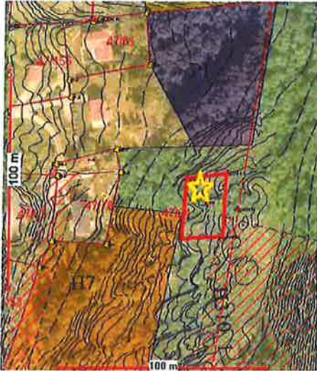
Figur 1, viser ønsket tomt.