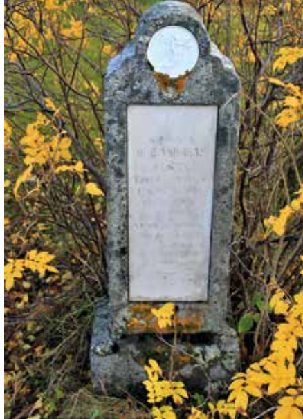
Utsnitt fra gravsteinen.

Gravgården ble aktivt brukt fram til 1932, da bygdas kirkegård fikk et nytt areal lenger øst, nedenfor dagens Aldersund kirke. Dette arealet ble